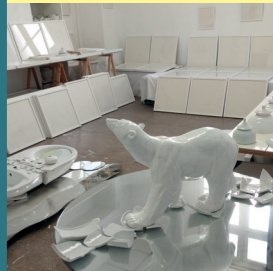
11 CLAUDIE DADU