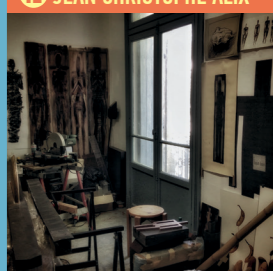
13 PATRICK PAVAN