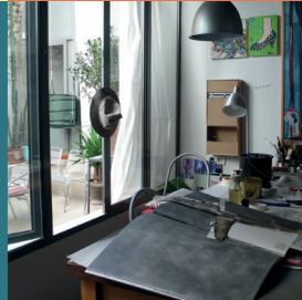
10 MARIE-JOSÉ DOUTRES

Pour retrouver la liste de l'ensemble des artistes participants, localiser leurs ateliers, découvrir leurs univers et leur actualité : laregion.fr/jpo-ateliers-artistes