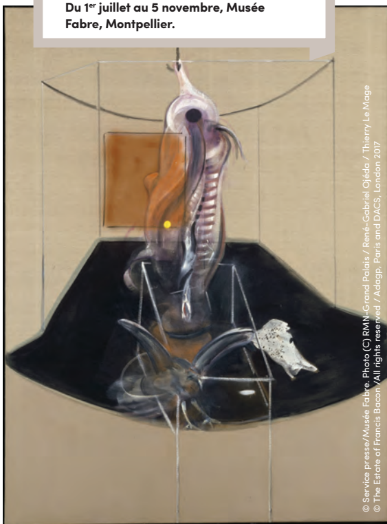
© Service presse/Musée Fabre, Photo (C) RMN-Grand Palais / René-Gabriel Ojeda / Thierry Le Mage © The Estate of Francis Bacon / All rights reserved / Adagp, Paris and DACS, London 2017

Francis Bacon Carcass of Meat and Bird of Prey 1980 Huile sur toile 198 x 147 cm Lyon, musée des Beaux-Arts, legs Jacqueline Delubac, 1997.