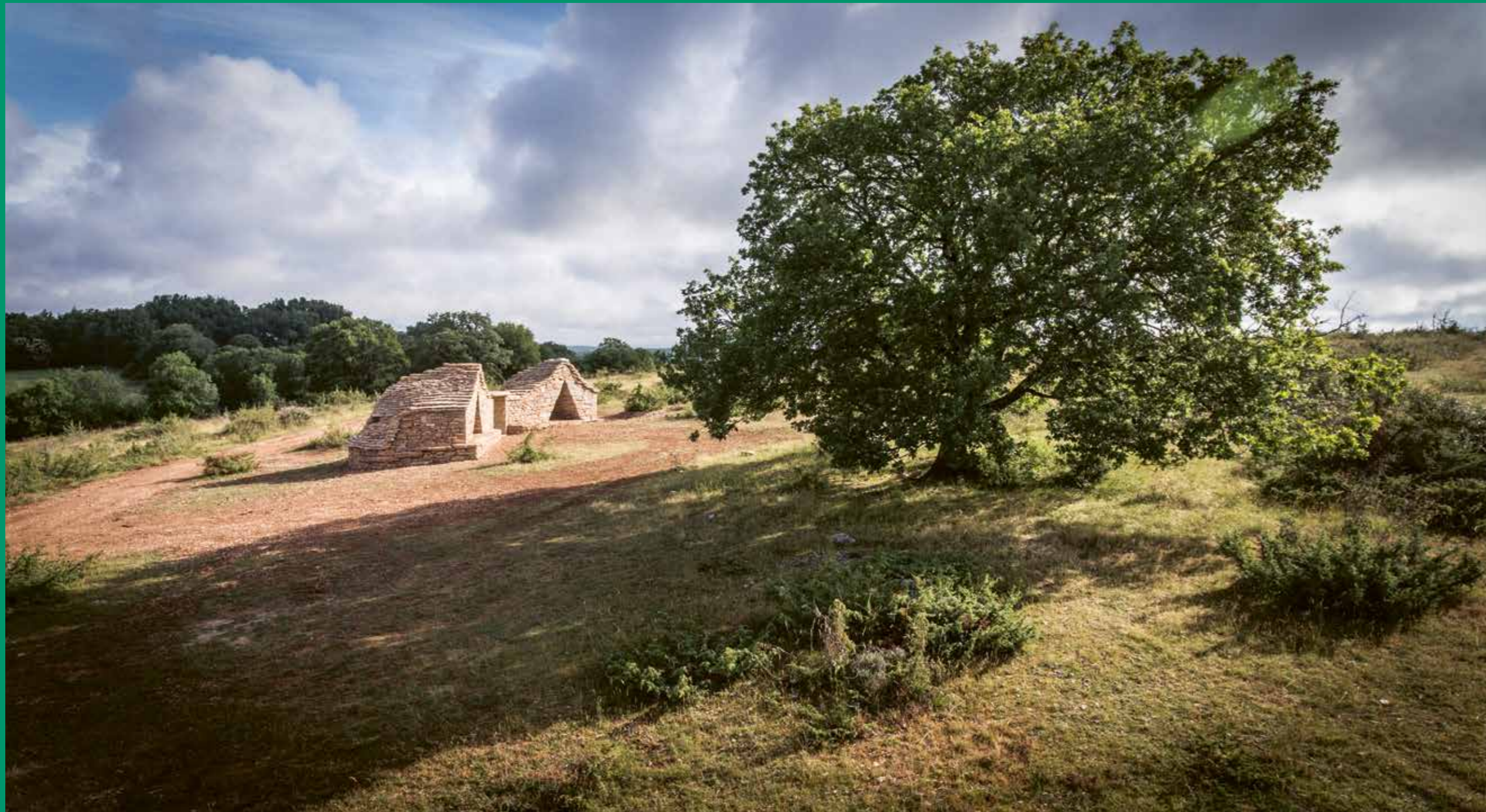
Super-Cayrou, printemps 2020 à Gréalou, 1 er œuvre d'art-refuge d'une série à venir sur les chemins de Compostelle