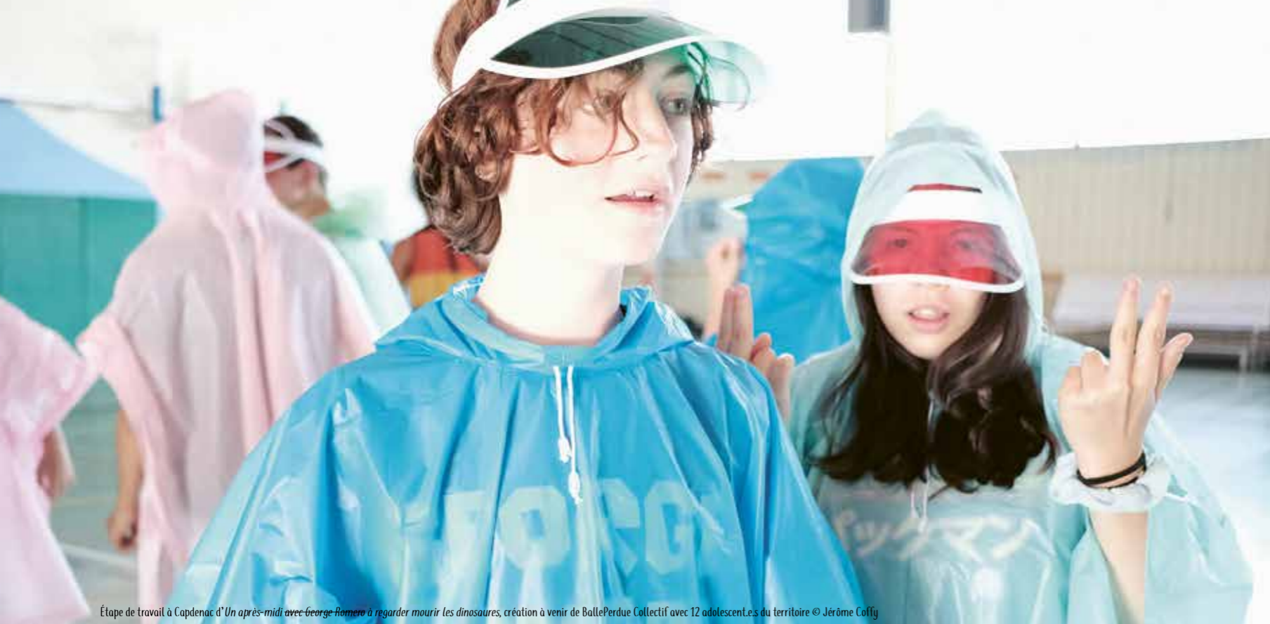
Étape de travail à Capdenac d'Un après-midi avec George Romero à regarder mourir les dinosaures, création à venir de BallePerdue Collectif avec 12 adolescents du territoire