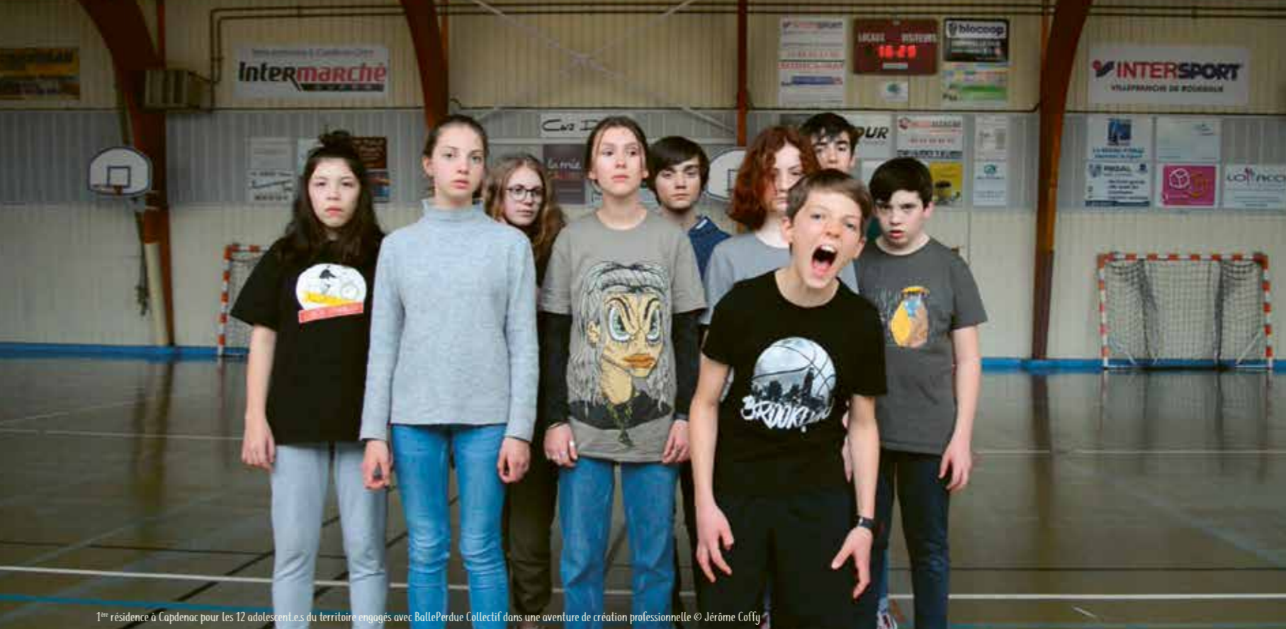
1 er résidence à Capdenac pour les 12 adolescents du territoire engagés avec BallePerdue Collectif dans une aventure de création professionnelle

Notre aventure existe grâce à l'implication de 22 administrateurs/trices bénévoles et motivés, la présence très précieuse des nombreux bénévoles et hôtebergeants, le soutien de l'ensemble des équipes de billetterie, des équipes techniques intermittentes, des services municipaux et des élus des collectivités partenaires, du cabinet comptable Bouloc Groupe 28, de fournisseurs fidèles, des équipes d'Accueil et Partage, des partenaires média et journalistes, et bien entendu de tous nos adhérents fidèles et indispensables. Merci à eux, merci à vous.