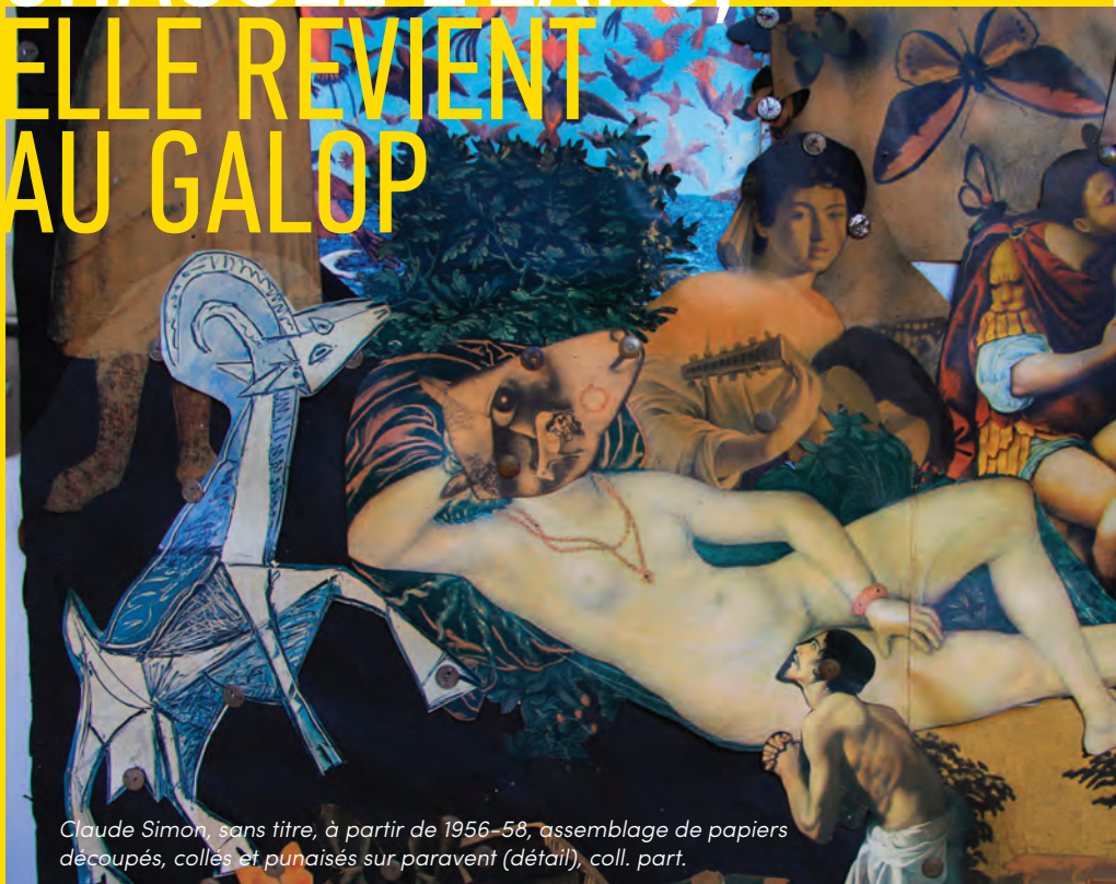
Claude Simon, sans titre, à partir de 1956-58, assemblage de papiers découpés, collés et punaisés sur paravent (détail), coll. part.