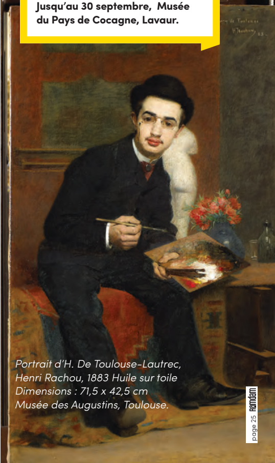
Portrait d'H. De Toulouse-Lautrec, Henri Rachou, 1883 Huile sur toile Dimensions : 71,5 x 42,5 cm Musée des Augustins, Toulouse.