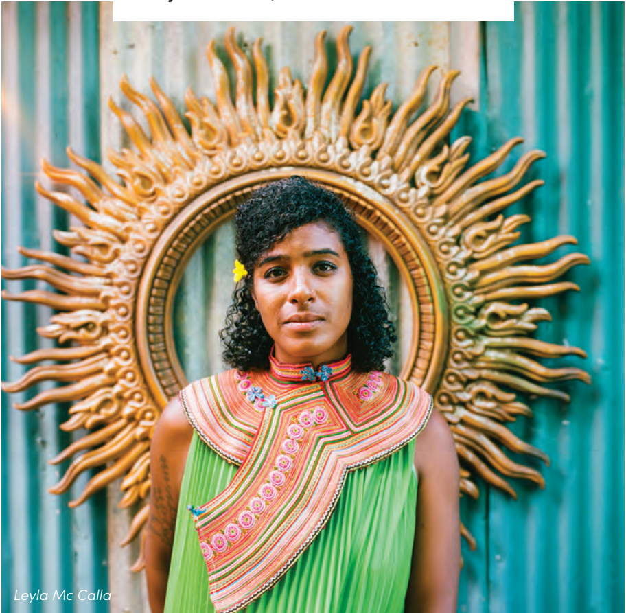
Leyla Mc Calla